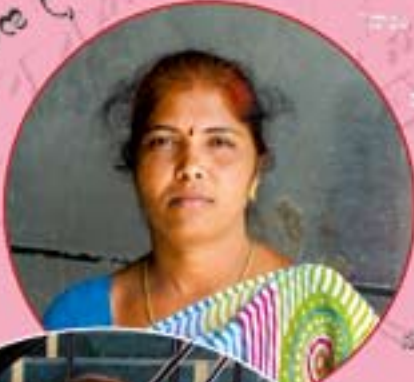
మారుమూల ప్రాంతాల్లో నివసించే మహిళల జీవితం

రావాలి, వదిలొచ్చేందుకు ప్రతి రోజు మూడు నాలుగు